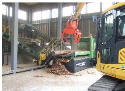
コマツボイラー用破砕機