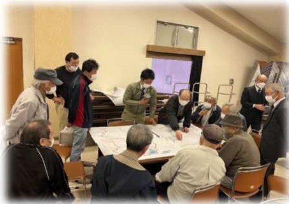
R4加賀山中地区事業推進会