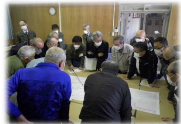
R4白山地区事業推進会