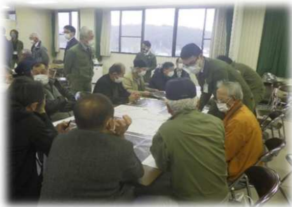
R4小松地区事業推進会