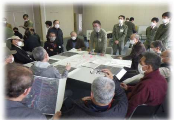
R4辰口地区事業推進会