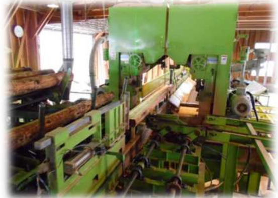
ツインバンドソー